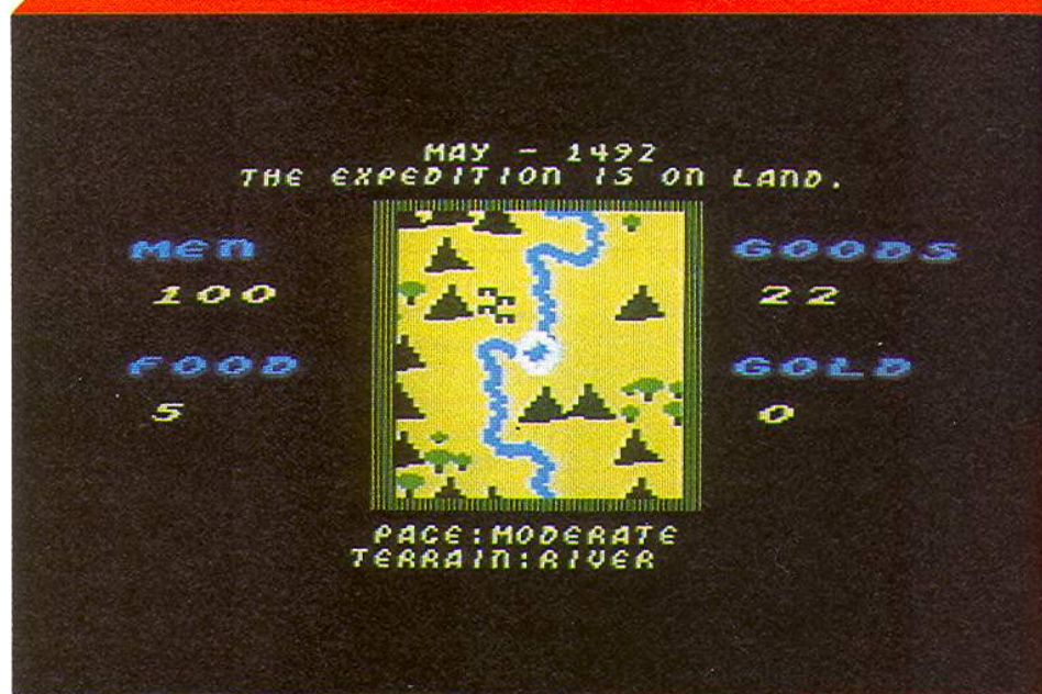
Im Eingeborenendorf wartet ein habgieriger Häuptling

Die Expedition hat drei Schauplätze: Spanien, das Meer und die Neue Welt. Alle Aktionen werden mit dem Joystick ausgeführt, doch zuerst heißt es: auf's Meer hinaus! Stürme, Untiefen und Seuchen machen einem das Leben schwer, treiben die Schiffe weit vom Kurs ab und dezimieren die Mannschaft. Nach einer halben