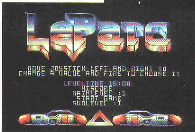
Im Menü lassen sich diverse Voreinstellungen treffen