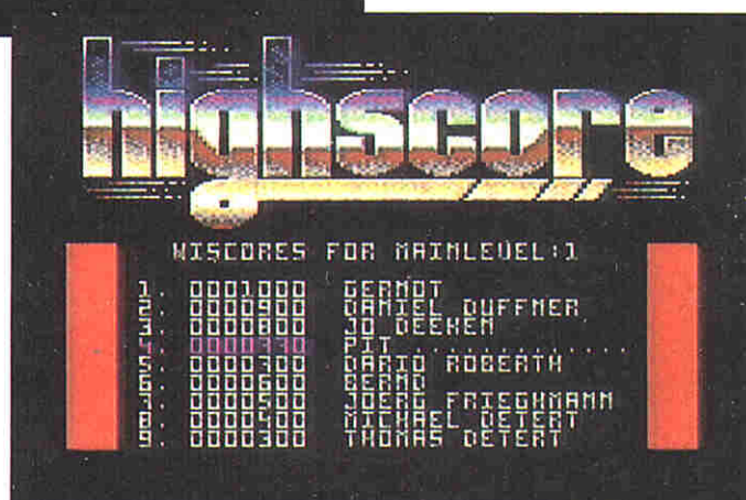
Die High-score-Tabelle (speicherbar)