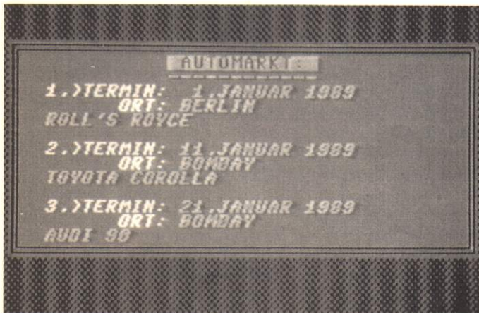
[3] Diese Termine sollte man nicht versäumen: Automobilausstellungen

Zusätzlich können Sie einige »Extras« in Ihr Hotel einbauen, dazu müssen Sie den Punkt »Besonderes« anklicken: Restaurant, Aufzüge, Zimmerservice, Reinigung . Diese Luxuszugaben gibt's aber nicht umsonst und reißen ein kräftiges Loch in Ihre Kapitaldecke. Selbstverständlich dürfen Sie auch eines Ihrer Hotels veräußern (Menüpunkt »Verkauf«), wenn das Kleingeld knapp wird.